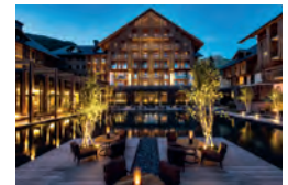
Andermatt THE CHEDI ANDERMATT www.chedianderlatt.com