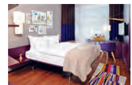
Zürich 25 HOURS HOTEL www.25hours-hotels.com