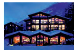
Saas Almagell HOTEL PIRMIN www.wellnesshotel-zurbriggen.ch