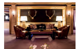
Gstaad GRAND HOTEL PARK www.grandhotelpark.ch