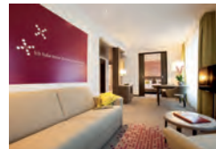
Schaffhausen ARCONA LIVING SCHAFFHAUSEN www.schaffhausen.arcona.ch

Exklusiv für die Wohnrevue testen ausgewählte Designer und Architekten Hotels in der Schweiz, Deutschland und Österreich.