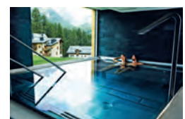
Silvaplana NIRA ALPINA www.niraalpina.com