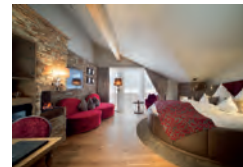
Schwangau / Allgäu (D) DAS RÜBEZAHL www.hotelruebezahl.de